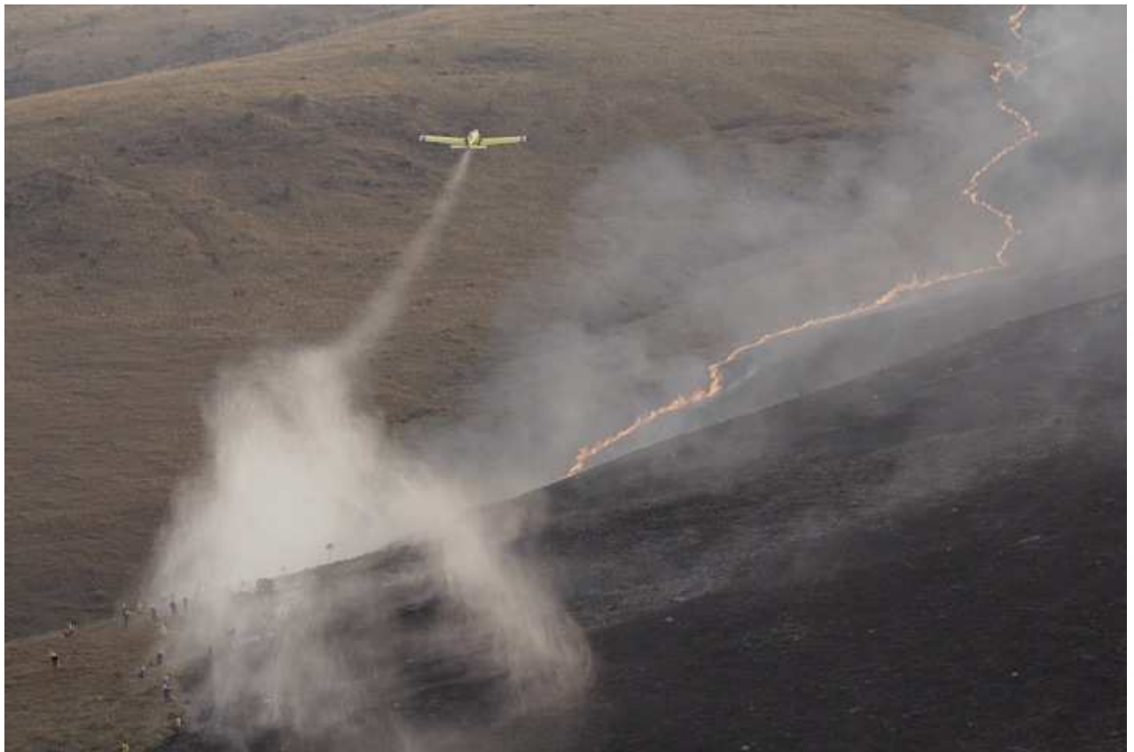
Figura 1: Combate a incêndio no Parque Nacional da Serra da Canastra.